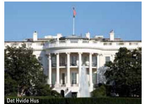
Det Hvide Hus

På vej til New York går turen fra nationens hovedstad Washington DC til fødestedet for nationens frihed, Philadelphia. Her skal I naturligvis besøge Liberty Hall og se den berømte klokke, der forkyndte USA's selvstændighed. Efter en lang dag er I tilbage i New York hen på eftermiddagen.