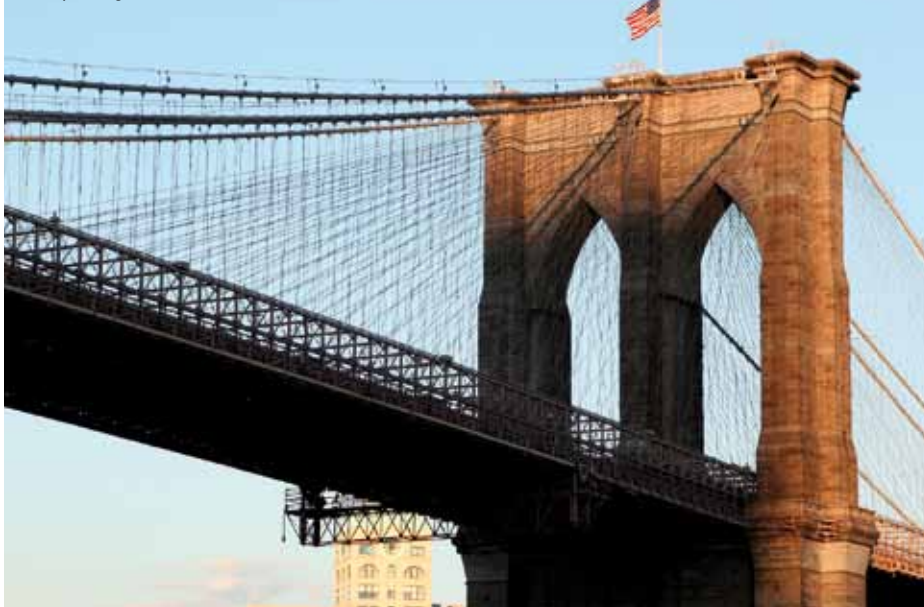
Brooklyn Bridge New York

Fra nationens hovedstad til fødestedet for nationens frihed. Her i Philadelphia skal I naturligvis besøge Independence Hall, hvor USA's uafhængighedserklæring og forfatning blev skrevet og i Liberty Hall se den berømte klokke, der forkyndte USA's frihed. Efter en lang og begivenhedsrig tur er I tilbage i New York.