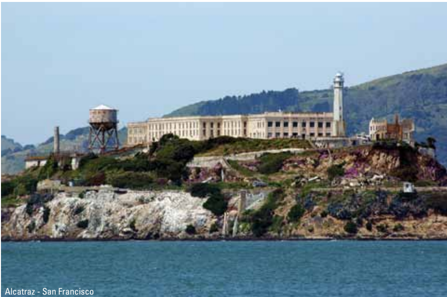
Alcatraz - San Francisco

Zion National Park er som en oase med vidunderlig frodighed midt i det ellers barske landskab. Dagen slutter i Las Vegas, hvor I bør strække benene på en spadseretur op og ned ad byens hovedstrøg, The Strip. Her kan man indimellem føle sig mere hensat til en futuristisk forlystelsespark på en anden planet, end til en by midt i Nevadas ørken.