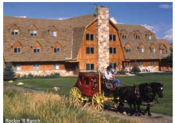
Rockin 'R Ranch