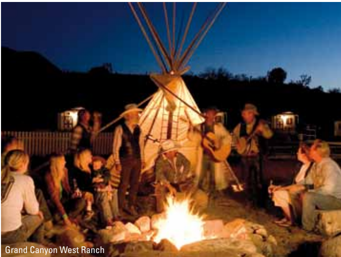
Grand Canyon West Ranch