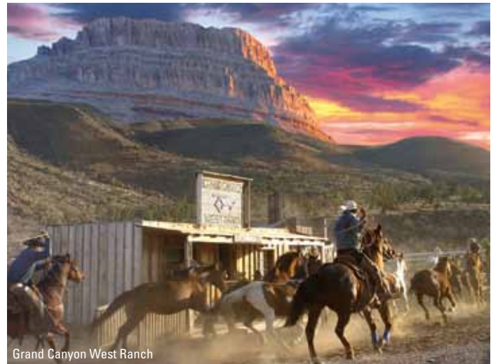
Grand Canyon West Ranch