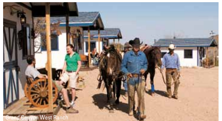
Grand Canyon West Ranch