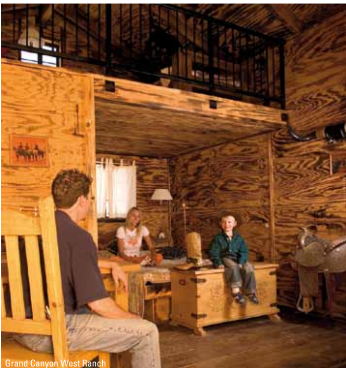
Grand Canyon West Ranch