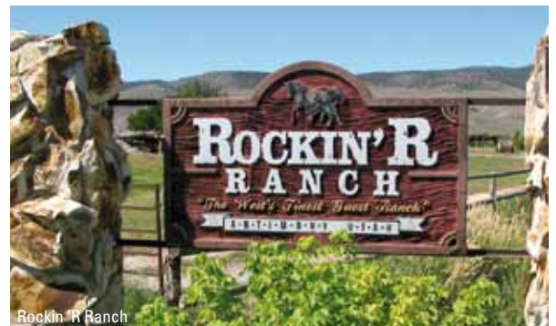
Rockin 'R Ranch

The Rockin 'R Ranch er en ægte, gammel, men stadig aktiv kvægranch beliggende i et naturskønt område ved byen Antimony med kun 168 indbyggere - ikke langt fra de 5 nationalparker; Bryce Canyon, Zion Canyon, Capitol Reef, Arches og Canyonlands. Her er 41 enkelt indrettede værelser med aircondition og eget toilet/bad. Ranchens aktiviteter omfatter ridelektioner, rideture, hestepleje, dans, fiskeri, "barrel racing", vandreture, bueskydning og aftenunderholdning. Her finder I ægte cowboyatmosfære. For at få den helt rigtige oplevelse anbefales det minimum at have 3 dage / 2 nætter for at nå at deltage i aktiviteterne og få den komplette cowboyoplevelse.