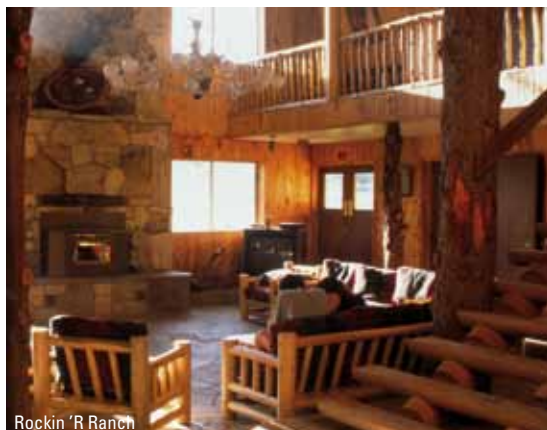
Rockin 'R Ranch