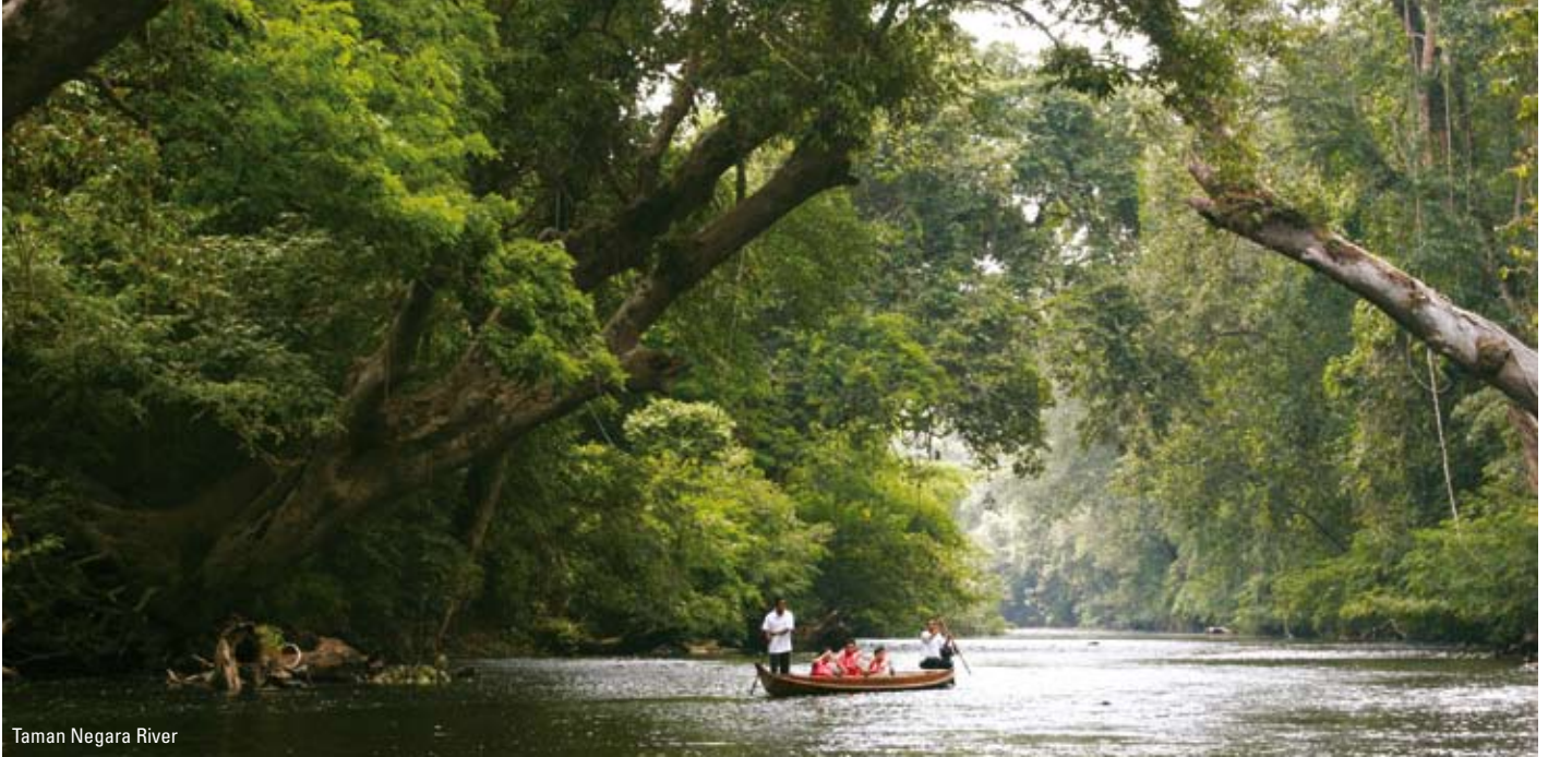
Taman Negara River

indkvarteres i en af resortets charmerende bungalows med aircondition og moderne badeværelse.