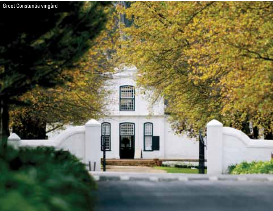
Groot Constantia vingård