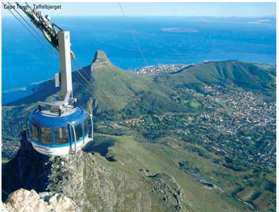
Cape Town - Tafelberget

høre mere om på en rigtig lokal og fungerende strudsefarm. Her kan vi handle diverse souvenirs som fjer, æg og skind. Vi bliver præsenteret for hele produktionsforløbet og skal også opleve et strudsekærløb. Du må veje mindre end 75 kg for at kunne ride på en struds. Vi spiser sen frokost på farmen - naturligvis med struds på menuen. Senere kan du ose lidt rundt i byen inden vi checker ind på hotellet. Her er der afslapning resten af dagen og dejlig husmandskost om aftenen. (M,F,A)